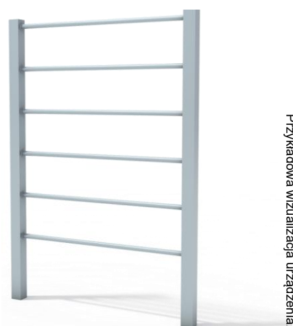
Przykładowa wizualizacja urządzenia.

Materiał: urządzenie wykonane z wysokiej jakości stali spawalniczej, dwukrotnie malowane proszkowo. Elementy stalowe zabezpieczone antykorozyjnie poprzez śrutowanie i cynkowanie. Wszystkie śruby zabezpieczone zaślepkami polimerowymi. Kolorystyka urządzeń w standardzie szara lub szaro-żółta.