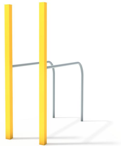
Przykładowa wizualizacja urządzenia.

Materiał: urządzenie wykonane z wysokiej jakości stali spawalniczej, dwukrotnie malowane proszkowo. Elementy stalowe zabezpieczone antykorozyjnie poprzez śrutowanie i cynkowanie. Wszystkie śruby zabezpieczone zaślepkami polimerowymi. Kolorystyka urządzeń w standardzie szara lub szaro-żółta.