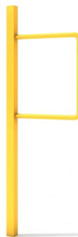
Przykładowa wizualizacja urządzenia.

Materiał: urządzenie wykonane z wysokiej jakości stali spawalniczej, dwukrotnie malowane proszkowo. Elementy stalowe zabezpieczone antykorozyjnie poprzez śrutowanie i cynkowanie. Wszystkie śruby zabezpieczone zaślepkami polimerowymi. Kolorystyka urządzeń w standardzie szara lub szaro-żółta.