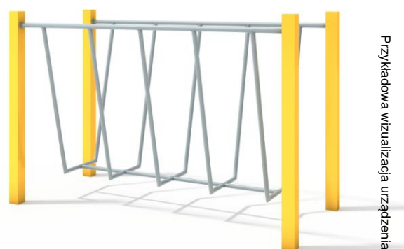
Przykładowa wizualizacja urządzenia.

Materiał: urządzenie wykonane z wysokiej jakości stali spawalniczej, dwukrotnie malowane proszkowo. Elementy stalowe zabezpieczone antykorozyjnie poprzez śrutowanie i cynkowanie. Wszystkie śruby zabezpieczone zaślepkami polimerowymi. Kolorystyka urządzeń w standardzie szara lub szaro-żółta.