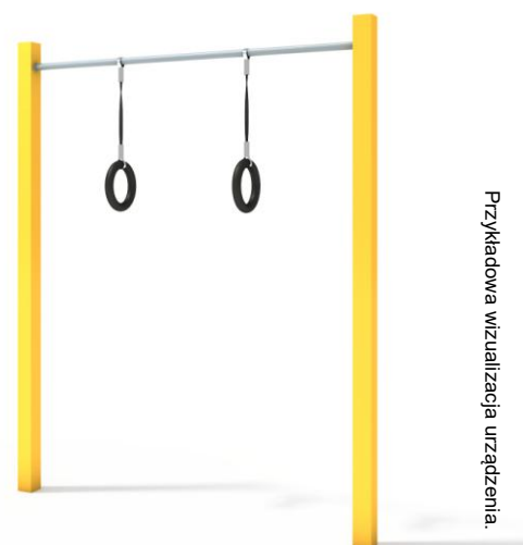
Przykładowa wizualizacja urządzenia.

Materiał: urządzenie wykonane z wysokiej jakości stali spawalniczej, dwukrotnie malowane proszkowo. Elementy stalowe zabezpieczone antykorozyjnie poprzez śrutowanie i cynkowanie. Wszystkie śruby zabezpieczone zaślepkami polimerowymi. Kolorystyka urządzeń w standardzie szara lub szaro-żółta.