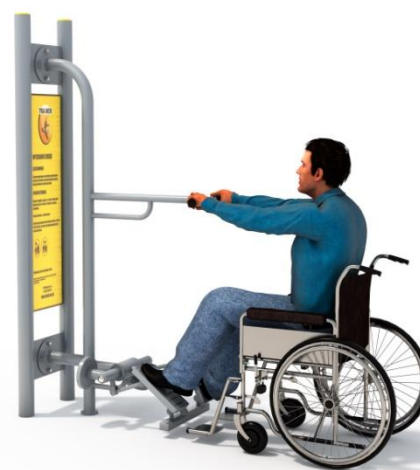
Przykładowa wizualizacja urządzenia.

* Rysunek ma charakter poglądowy. Faktyczny wygląd urządzenia może nieznacznie odbiegać od przedstawionej wizualizacji.