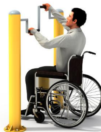
Przykładowa wizualizacja urządzenia.

* Rysunek ma charakter poglądowy. Faktyczny wygląd urządzenia może nieznacznie odbiegać od przedstawionej wizualizacji.