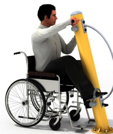
Przykładowa wizualizacja urządzenia.

* Rysunek ma charakter poglądowy. Faktyczny wygląd urządzenia może nieznacznie odbiegać od przedstawionej wizualizacji.