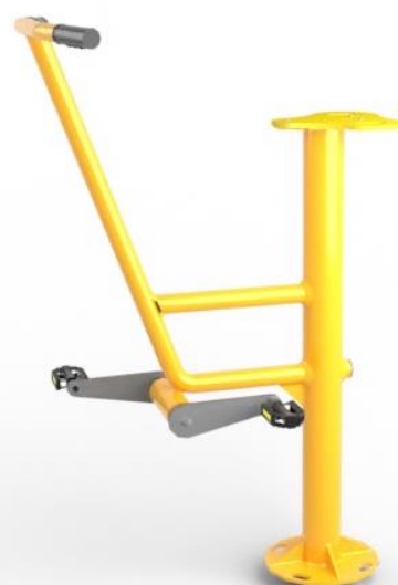
Przykładowa wizualizacja urządzenia.

* Rysunek ma charakter poglądowy. Faktyczny wygląd urządzenia może nieznacznie odbiegać od przedstawionej wizualizacji.