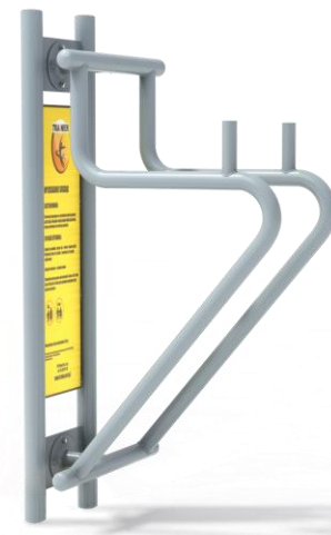
Przykładowa wizualizacja urządzenia.

* Rysunek ma charakter poglądowy. Faktyczny wygląd urządzenia może nieznacznie odbiegać od przedstawionej wizualizacji.