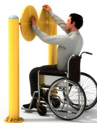
Przykładowa wizualizacja urządzenia.

* Rysunek ma charakter poglądowy. Faktyczny wygląd urządzenia może nieznacznie odbiegać od przedstawionej wizualizacji.