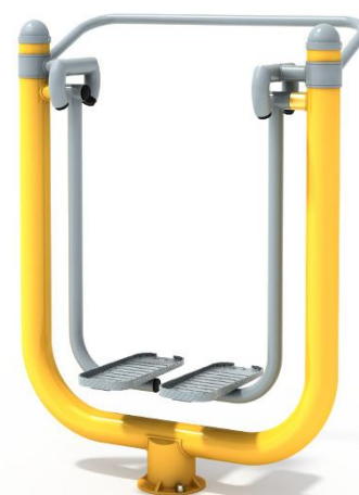
Przykładowa wizualizacja urządzenia.

* Rysunek ma charakter poglądowy. Faktyczny wygląd urządzenia może nieznacznie odbiegać od przedstawionej wizualizacji.