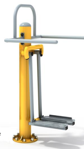
Przykładowa wizualizacja urządzenia.

* Rysunek ma charakter poglądowy. Faktyczny wygląd urządzenia może nieznacznie odbiegać od przedstawionej wizualizacji.