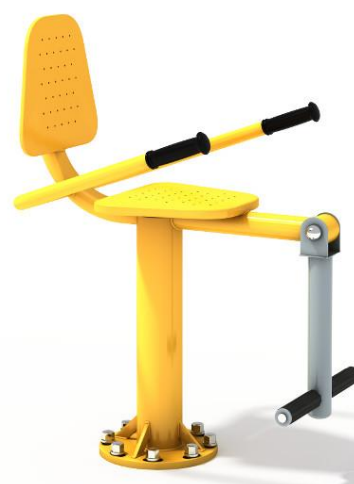
Przykładowa wizualizacja urządzenia.

Wyrób spełnia wymagania bezpieczeństwa zawarte w normie PN-EN 16630:2015-06.